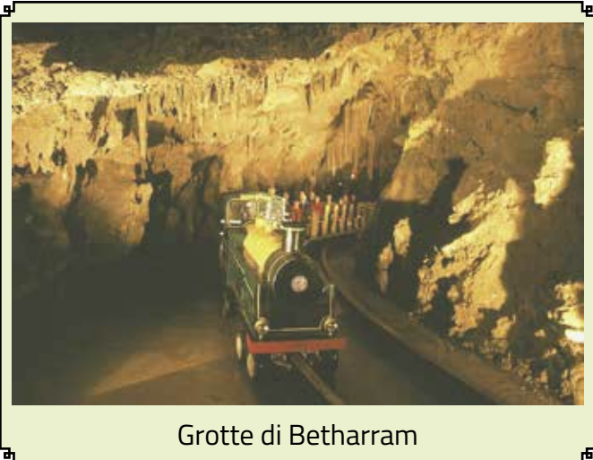
Grotte di Betharram