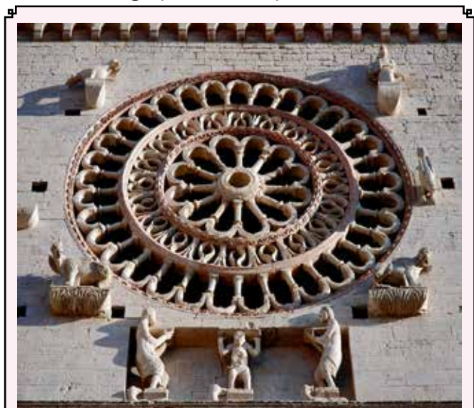
ASSISI - Cattedrale di San Rufino

Visiteremo il Palazzo dei Consoli che si affaccia sulla Piazza Grande, il Duomo, la Chiesa di San Francesco e la duecentesca costruzione del Palazzo del Capitano. Rientro a Perugia per la cena e pernottamento.