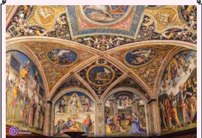
PERUGIA - Palazzo dei Priori

Dopo pranzo trasferimento a Gubbio. Visita di questa antica e nobile città splendidamente distesa sui contrafforti del Monte Ingino.