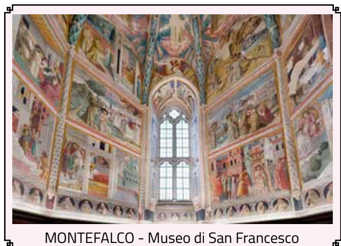
MONTEFALCO - Museo di San Francesco

Partenza per Spello suggestiva e antica cittadina felicemente ubicata alle falde meridionali del Monte Subasio. Si visiterà la trecentesca cappella Tega, la Chiesa di Santa Maria Maggiore, la Chiesa di Sant'Andrea e il Palazzo Comunale Vecchio. Spostamento a Montefalco. Visita d'obbligo è il Museo di San Francesco dove si possono ammirare gli affreschi di Benozzo Gozzoli appena restaurati.