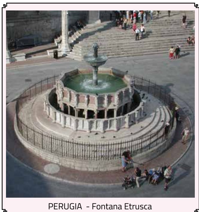
PERUGIA - Fontana Etrusca

del periodo di massimo splendore dell'arte perugina in epoca gotica e rinascimentale. A Perugia, non può mancare una visita alla Fontana Etrusca. Scendete con noi e lasciatevi stupire da come si costruiva in passato. Pranzo nel centro città.