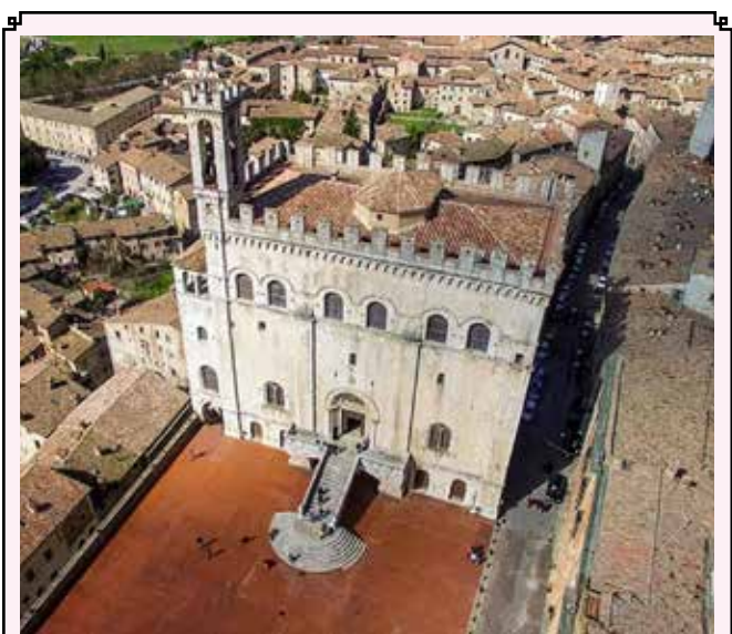
GUBBIO - Palazzo dei Consoli

Prima colazione, incontro con la guida e partenza per Assisi e visita alla Basilica di San Francesco, grandioso e imponente complesso che caratterizza sin da lontano, il sereno scenario rurale del paesaggio umbro. Si proseguirà con la visita alla Cattedrale di San Rufino e alla Basilica di Santa Chiara.